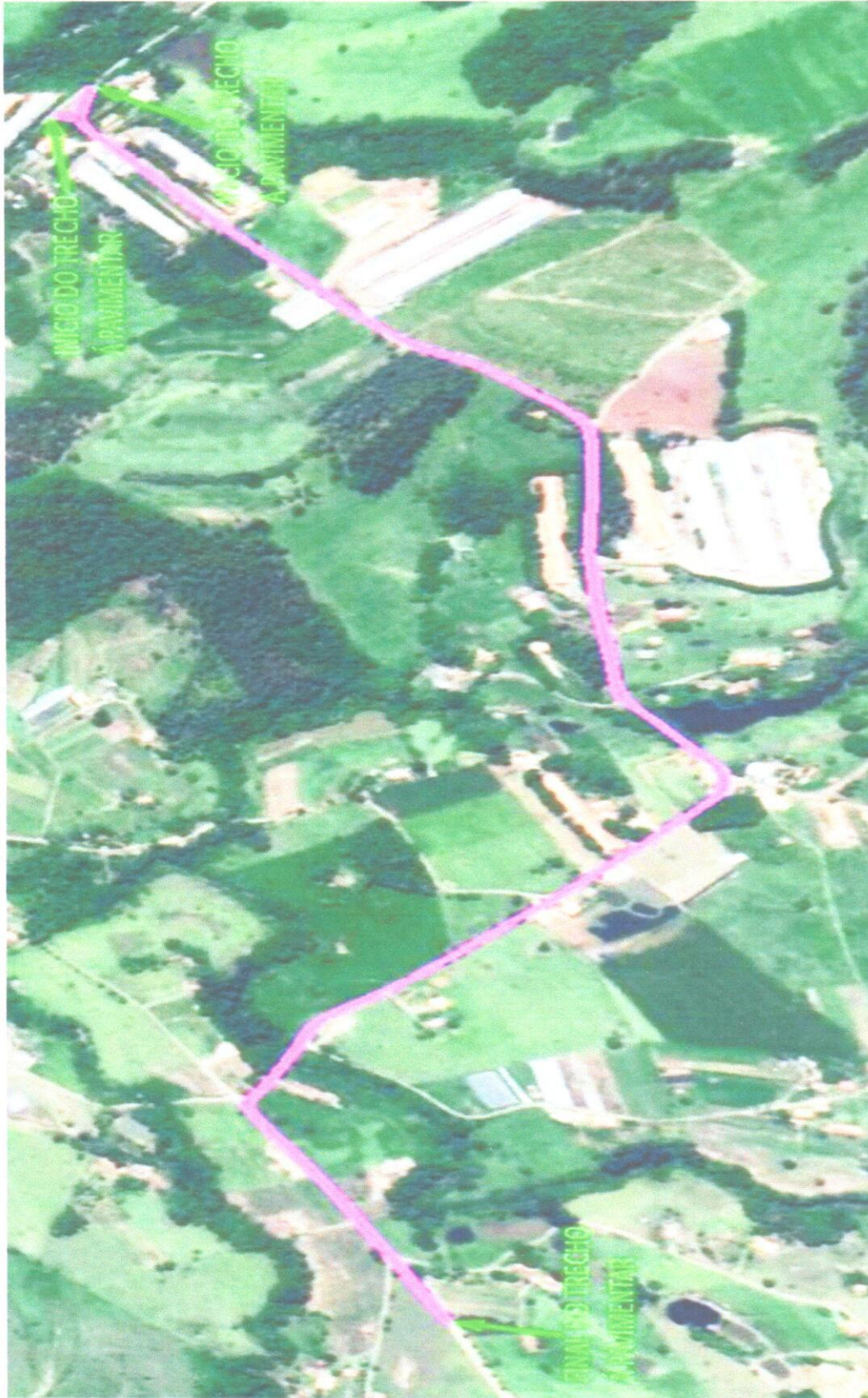
Croqui de Localização

Rua da Bandeira, nº 500 | Cabral | Curitiba/PR | CEP 80035-270 Tel.: 41 3250-2100 | http://www.idrparana.pr.gov.br |